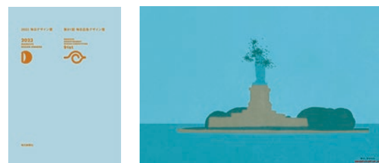
第91回 毎日広告デザイン賞 最高賞 AD：砂田 肇 C：石原拓実 課題：地球の歩き方「地球の歩き方」 30段カラー 3点シリーズ